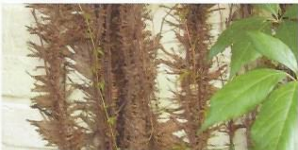
Een duidelijk voorbeeld van een hechtende klimplant.

In twee artikelen licht ik toe welke strategieën klimplanten hanteren om omhoog te kruipen. De meeste zijn immers bosplanten en maken gebruik van bomen en struiken om hoger op te geraken. Een groot voordeel bij de keuze voor je gevel: de keuze is beperkt tot slechts 17 courante klimplanten.