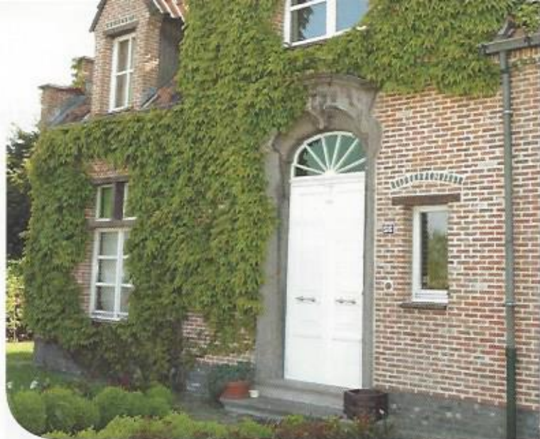
Zonder groeibegrenzer vertonen veel hechtende klimplanten een anstuitbare groei.

Gevelgroen koelt de stad door verdamping, houdt je gevel fris en biedt mogelijk nog heerlijke vruchten onder je pergola. Een straat met tegeltuinen betekent ook thuishoeren in een uniek stukje natuur.