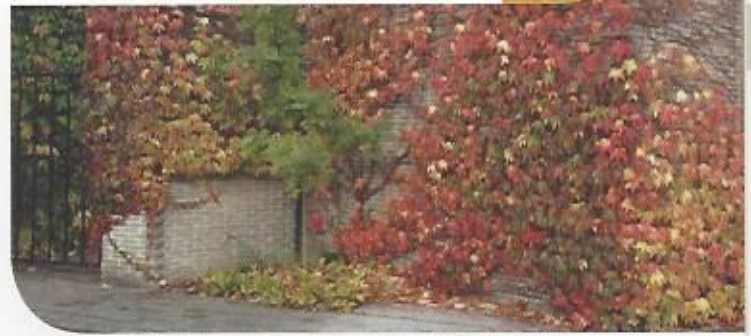
Driedelige wingerd is samen met klimop een bekende hechtende klimmer. Bovendien heeft wingerd een prachtige herfstverkleuring.

Driedelige wingerd ( Parthenocissus tricuspidata ) kan tot 30 m hoog klimmen. Hij kan zelfs naar beneden toe groeien op haast alle materialen. Zijn klimsporen zijn minder storend dan bij klimop, maar zijn groei is niet te stuiten.